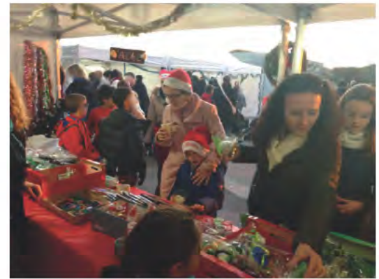
Marché de Noël des écoles