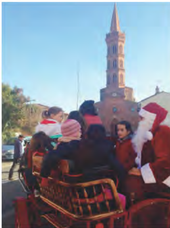
Balade en calèche