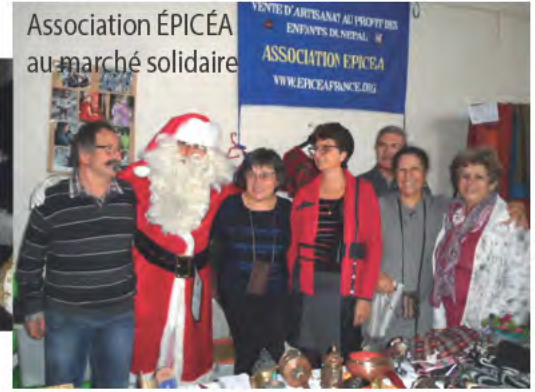
Association ÉPICÉA au marché solidaire