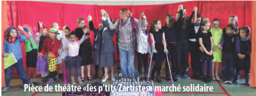
Pièce de théâtre «les p'tits Zartistes» marché solidaire