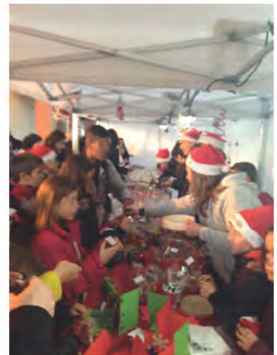
Marché de Noël des écoles