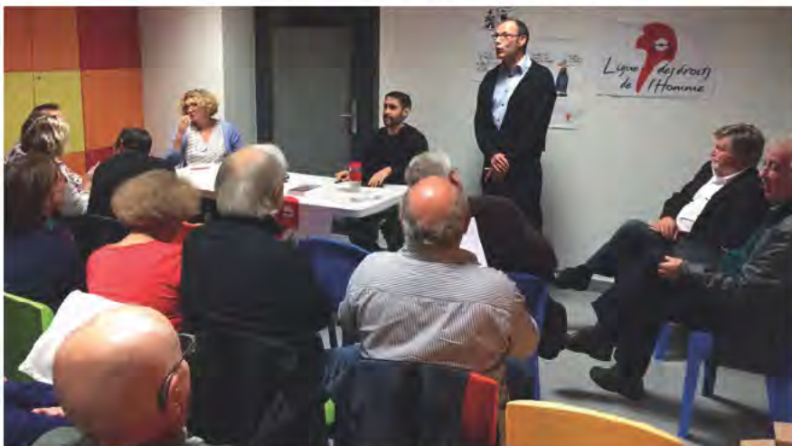
Conférence « Dans la peau d'un migrant »