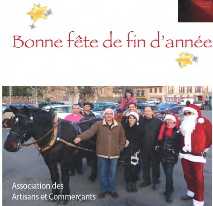
Association des Artisans et Commerçants