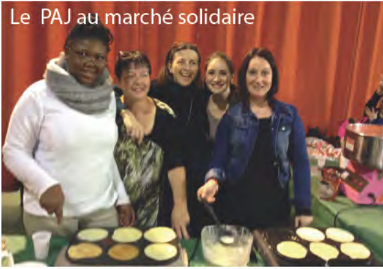
Le PAJ au marché solidaire