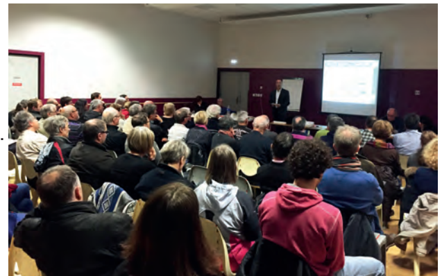
Réunion municipale publique du 24 mars 2016

Aujourd'hui, il faut savoir que l'enveloppe de 120 000 € sert essentiellement à l'entretien des réseaux et de la voirie.