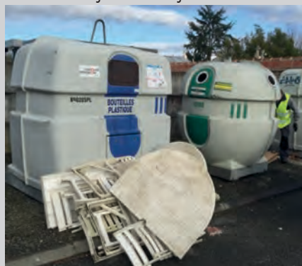
Point de tri cimetière de Brax - avril

Cornebarrieu , tel : 05 34 40 07 68 Route d'Aussonne Ouverture lundi, mardi, mercredi, vendredi de 10h à 12h et de 13h30 à 18h samedi et dimanche de 10h à 18h. Fermeture le jeudi et les jours fériés.