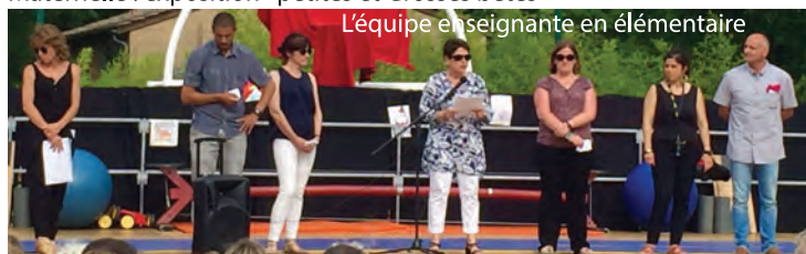
L'équipe enseignante en élémentaire