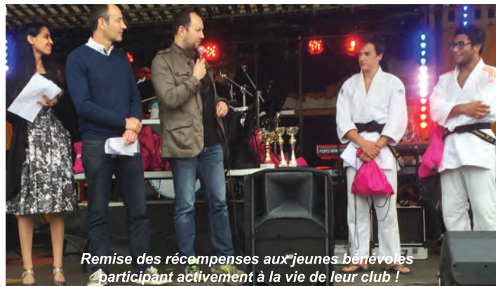
Remise des récompenses aux jeunes bénévoles participant activement à la vie de leur club !

Le spectacle a pu se monter grâce au Bureau Culture de Toulouse Métropole que nous remercions sincèrement tant les enfants se sont enthousiasmés pour ce projet !