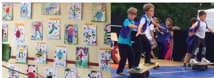
Numéro de cirque

Ces belles animations ont été suivies d'un apéritif offert par l'APEB et d'un repas partagé.