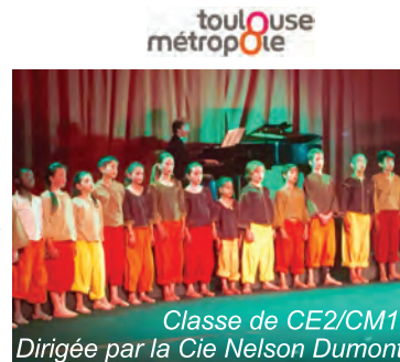
Classe de CE2/CM1 Dirigée par la Cie Nelson Dumont

Plus de 100 spectateurs sont venus voir les enfants jouer et chanter à la salle des fêtes, le 3 juin. Ce spectacle a été élaboré tout au long de l'année avec les élèves de CE2/CM1 de Mme Fortuny sous la direction de Eljesa et Martine, de la Cie Nelson Dumont .