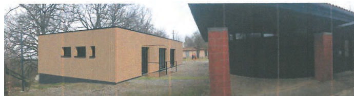
➔ Rhéhabilitation du Pavillon des petits 3/6 ans

Le financement de cette construction bénéficiera d'aides de la CAF et du Conseil Départemental, de fonds propres au Syndicat Mixte, qui, depuis quelques années, met en réserve des sommes pour ce projet, et d'un emprunt dont les échéances seront similaires au montant de la location des bungalows actuels.