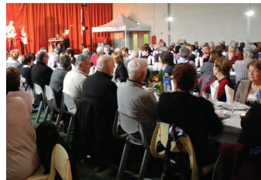
Repas des aînés 2017 Convivialité