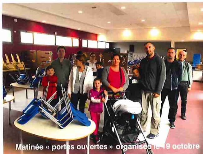
Matinée « portes ouvertes » organisée le 19 octobre

Aussi, une nouvelle matinée portes ouvertes sera organisée après la mise en service de la deuxième phase.