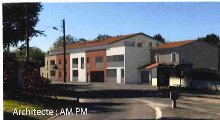
Architecte : AM PM

Programme situé au centre de BRAX, comprenant 23 logements locatifs sociaux répartis en 7 logements individuels et un bâtiment collectif de 16 logements avec des typologies variées parmi lesquels 9 logements sont destinés aux seniors. Au total, il y aura 4 T2, 14 T3, 5 T4 pour 46 places de parking.