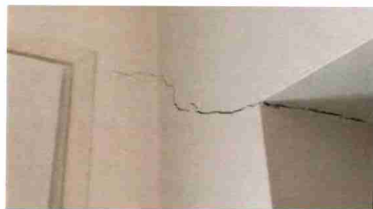
Les fissures sont dues à un phénomène naturel de retrait-gonflement : le sous-sol se rétracte en période de fortes chaleurs puis se dilate trop vite lorsque l'humidité revient. Ces mouvements de terrain, plus répandus sur des sols argileux, affectent alors les fondations des habitations, lézardent les murs, les clôtures, les terrasses.