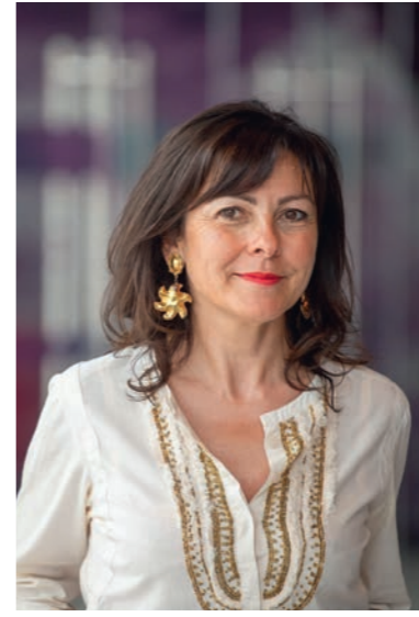
Carole DELGA Présidente de la Région Occitanie

Cette ambition revêt des enjeux multiples. Enjeux sociaux. Les hausses des prix des carburants et des frais d'entretien des véhicules pénalisent d'abord les foyers les plus modestes et les classes moyennes. Enjeux de santé publique et climatiques. La pollution de l'air déclenche des affections respiratoires durables chez 16% des enfants et est responsable, en France, de 40 000 décès chaque année. Elle accélère le dérèglement climatique : le poids des déplacements dans les émissions de gaz à effet de serre est de 42 % sur l'aire d'attraction de Toulouse. Enjeux économiques et territoriaux. Quelle entreprise a envie de s'implanter dans un territoire mal desservi ? L'absence d'infrastructures et de services est synonyme d'appauvrissement pour un bassin de vie. Nous œuvrons au contraire pour une juste répartition des emplois et des richesses dans l'aménagement de notre région et de notre pays.