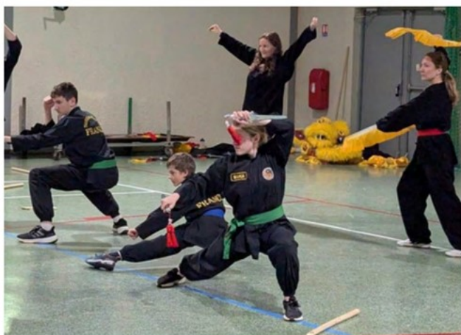
Fête pour les 10 ans du club