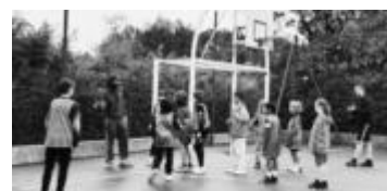
Stage de la Toussaint 2025