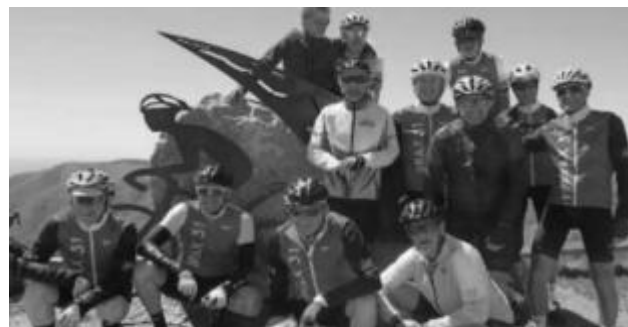
Séjour en Lozère et Gard, mont Aigoual

Sans oublier nos sorties du dimanche et en semaine dans le secteur du Gers, ou lors des organisations de randonnées cyclo proposées le dimanche par des clubs autour de Toulouse affiliés à la FSQT 31. Vous pouvez retrouver le calendrier sur le site : www.cyclotourisme-31.com dans le menu « Événements ». Vous pouvez aussi consulter la page Facebook « Cyclo Randonneur Braxéen ».