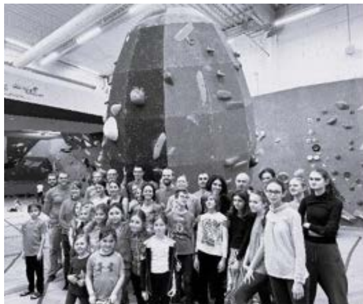
Notre sortie à Block'Out 14 janvier 2024, tous motivés!