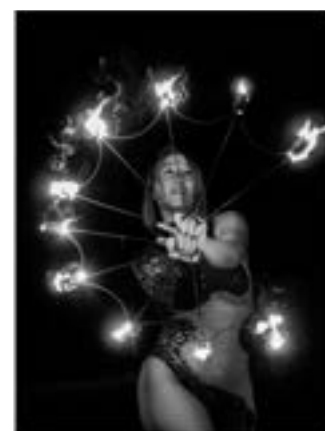
Démonstration des Dream Girls