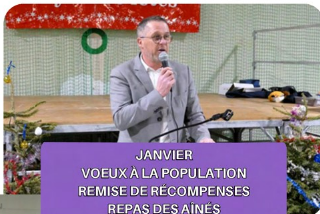
JANVIER VOEUX À LA POPULATION REMISE DE RÉCOMPENSES REPAS DES AÎNÉS