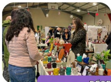
DÉCEMBRE MARCHÉ SOLIDAIRE DE NOËL

La riche vie braxeenne de ces derniers mois en quelques clichés