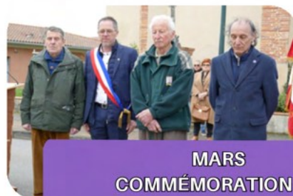
MARS COMMÉMORATION DE LA GUERRE D'ALGÉRIE