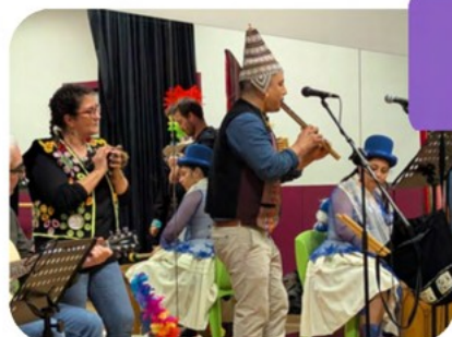
MARS EXPO ALTIPLANO ANDIN MARA DE PATAGONIE